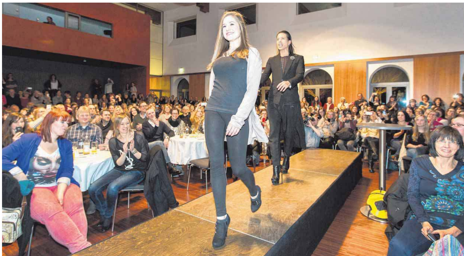
Laufen in Leutkirch: Jorge González zeigt, wie man aufrecht durchs Leben geht – und dabei anderen gefällt.

Der Mann ist inzwischen seine eigene Marke. Er arbeitet als Stylist, Model, Künstleragent, Choreograf, Imageberater und Designer. Seit 2013 sitzt er in der Jury der TV-Show „Let's Dance“. Und nicht zuletzt ist Jorge González Laufstegtrainer bei